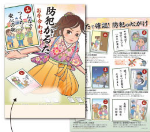
スローガンなどの 刷り込みが可能(黒一色)