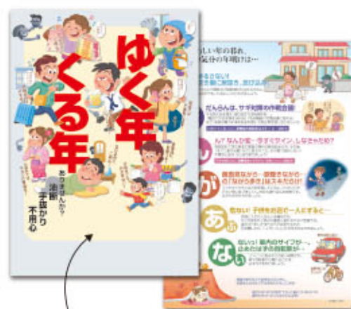
スローガンなどの 刷り込みが可能(黒一色)

ゆく年 くる年 コード 38-032 ありませんか？ 油断 手抜かり 不用心 A4判チラシ